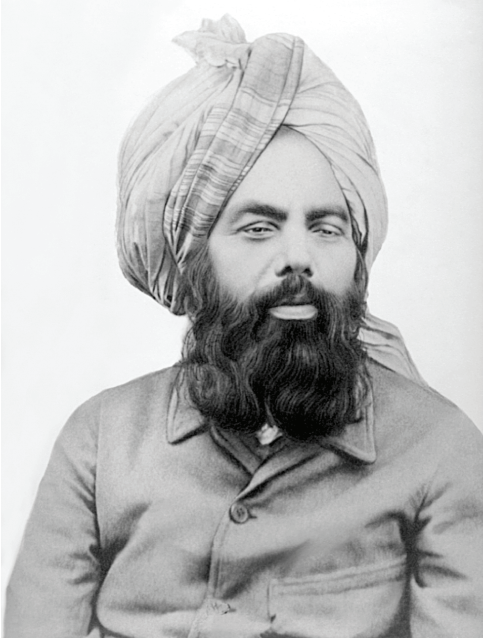
हज़रत मिर्ज़ा गुलाम अहमद साहिब क़ादियानी मसीह मौऊद व महदी माहूद अलैहिस्सलाम (1835 ई० - 1908 ई०) संस्थापक अहमदिया मुस्लिम जमाअत